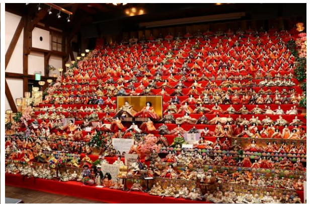
ひなまつりの様子