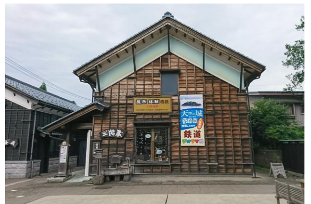
二階蔵（左手が平蔵）